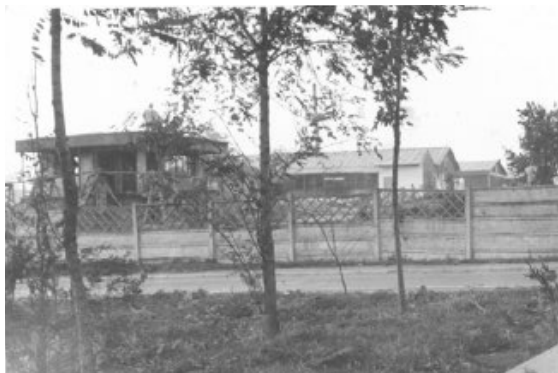
Тюрьма в Яссы, где Костикэ был с июля по сентябрь 1985 г.